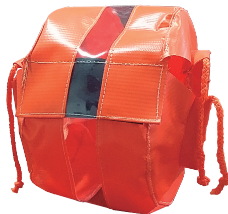
*Cubre Flange con visor.